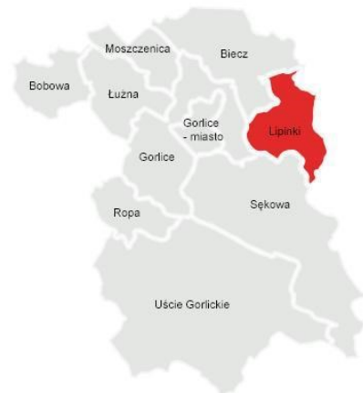
Rysunek 1 Mapa powiatu gorlickiego

Gmina Lipinki usytuowana jest w powiecie gorlickim, który obejmuje południowo-wschodnią część województwa małopolskiego. Gmina Lipinki sąsiaduje z gminą Biecz - na północy; z gminą Gorlice - na zachodzie; z gminą Sękowa - na południu; a od strony wschodniej z gminami Dębowiec i Skołyszyn, które objęte są terytorium województwa podkarpackiego. Gminę Lipinki tworzy 5 miejscowości: Bednarka, Kryg, Pagorzyna, Rozdziele i Wójtowa. Podział gminy na sołectwa kształtuje się podobnie, z tą różnicą iż występuje na terenie gminy przysiółek Bednarki o nazwie Bednarskie, który jest oddzielnym sołectwem. Powierzchnia Gminy Lipinki wynosi 66,16 km 2 co stanowi zaledwie 6,84% powierzchni powiatu gorlickiego.